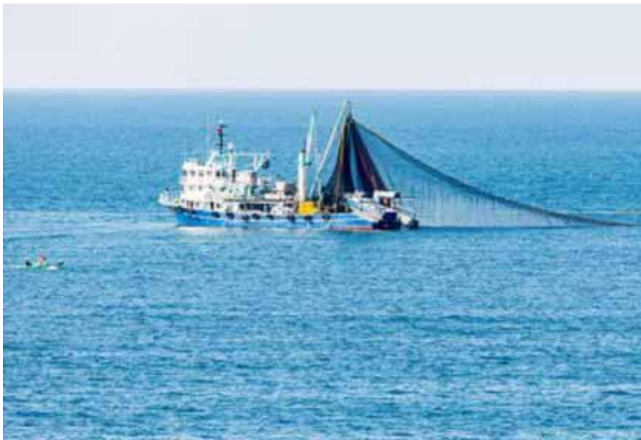
എംഎഫ്ആർഐയുടെ നേതൃത്വത്തിൽ നടന്നുവരുന്ന ത്. മെഴുകു ധാരാളമടങ്ങിയിരിക്കുന്നതിനാൽ ഇവ മനുഷ്യർക്ക് ഭക്ഷ്യയോഗ്യമല്ല. എന്നാൽ, മത്സ്യത്തീറ്റയ്ക്ക് ഇവയെ ഉപയോഗിക്കുന്നതിലൂടെ ഈ ആവശ്യങ്ങൾക്ക് തീരക്കടലുകളിലെ മിസോപെലാജിക് മത്സ്യങ്ങളെ അമിതമായി ആശ്രയിക്കുന്നത് തടയാനാകും. തീരക്കടലുകളിലെ മിസോപെലാജിക് മത്സ്യങ്ങളെ അമിതമായി ആശ്രയിക്കുന്നത് തടയാനാകും. തീരക്കടലുകളിലെ മിസോപെലാജിക് മത്സ്യങ്ങളെ അമിതമായി ആശ്രയിക്കുന്നത് തടയാനാകും.

കൊച്ചി: സമുദ്രമത്സ്യ ഗവേഷണ സ്ഥാപനത്തിൽ (സിഎംഎഫ്ആർഐ) നടക്കുന്ന ത്രിദിന മത്സ്യമേളയിൽ പൊതുജന ശ്രദ്ധ നേടി ഇന്ത്യയുടെ ആഴക്കടൽ മത്സ്യബന്ധന ഗവേഷണ പദ്ധതി. ഏറെ സാധ്യതകളുള്ള ആഴക്കടലിലെ മത്സ്യവൈവിധ്യങ്ങൾ വേണ്ടവിധം പ്രയോജനപ്പെടുത്തുന്ന തുമായി ബന്ധപ്പെട്ടതാണ് സംയുക്ത ഗവേഷണ പദ്ധതി. ഇന്ത്യൻ സമുദ്രാതിർത്തിയിലെ ആഴക്കടലിൽ ഗണ്യമായ മത്സ്യസമ്പത്തുണ്ട്. എന്നാൽ, ഇവ പിടിക്കപ്പെടാതെ കിടക്കുകയാണ്. ഇതുമൂലം മീറ്റർ മുതൽ ആയിരം മീറ്റർ വരെ ആഴമുള്ള ഭാഗങ്ങളിൽ കാണപ്പെടുന്ന മിസോപെലാജിക് മത്സ്യങ്ങളെ മത്സ്യത്തീറ്റ ഉൾപ്പെടെയുള്ള നിരവധി ആവശ്യങ്ങൾക്കായി ഉപയോഗപ്പെടുത്താനുള്ള ഗവേഷണവികസന ശ്രമങ്ങളാണ് സി