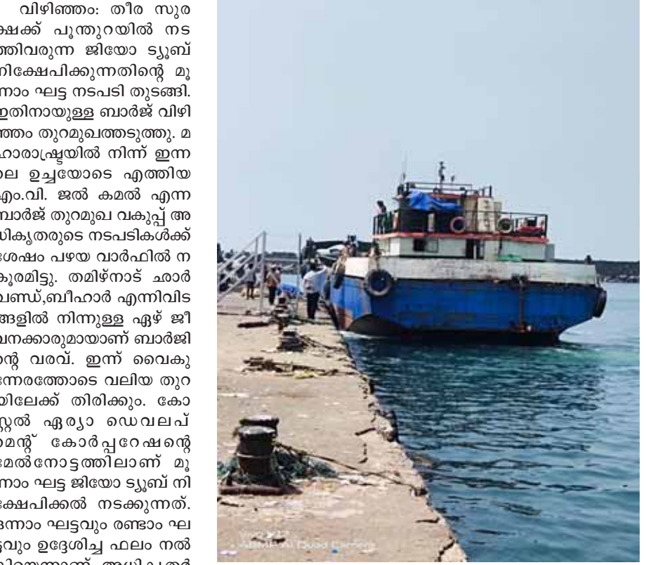
കുറയാൻ ലക്ഷ്യം. തിരുവനന്തപുരം ആസ്ഥാനമായി പ്രവർത്തിക്കുന്ന റോയൽ വേവ് ഷിപ്പിംഗ് ആന്റ് ലോജിസ്റ്റിക് കമ്പനിയുടെ ബോർഡ് ജിനെ ഇവിടെ എത്തിച്ചത്.