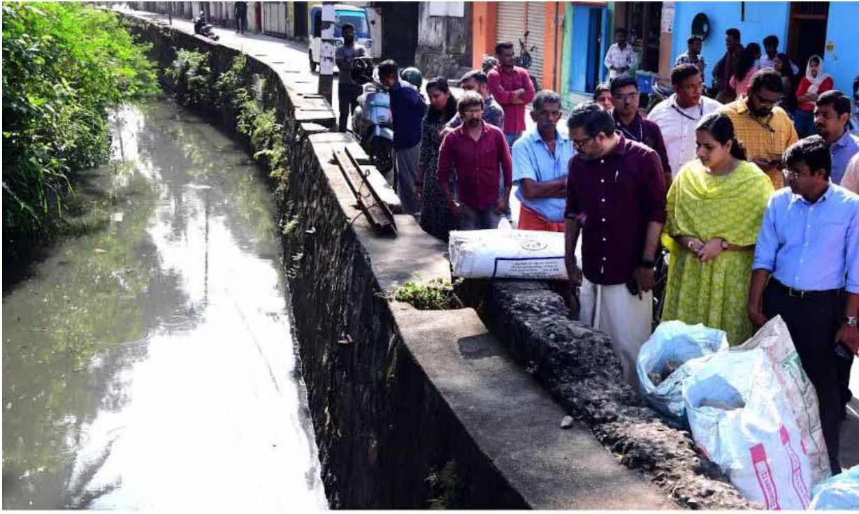
തദ്ദേശ സ്വയംഭരണ വകുപ്പ് മന്ത്രി എം ബി രാജേഷ് ആമയിഴഞ്ചാൻതോട് സന്ദർശിച്ച് ശുചീകരണ പ്രവർത്തനങ്ങൾ വിലയിരുത്തുന്നു