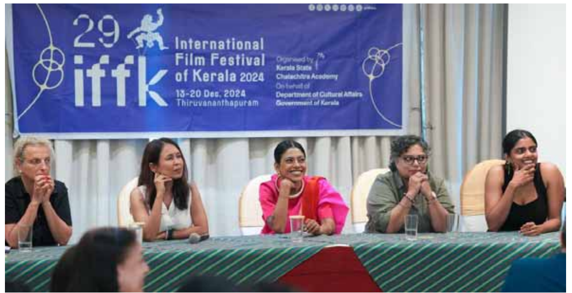
ഹോട്ടൽ ഹൊറൈസന്റിൽ മേൽക്കൈത്തീയ പ്രമുഖ വനിതാ ചലച്ചിത്ര പ്രവർത്തകർ അണിനിരന്നപ്പോൾ