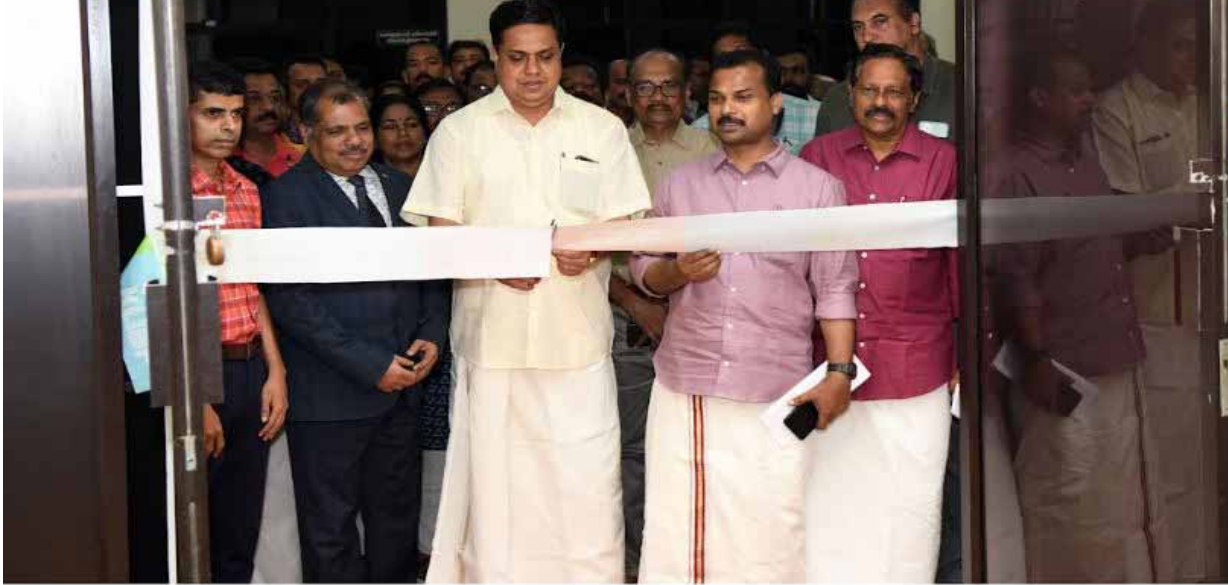
നിയമസഭാ പുസ്തകോത്സവത്തിന്റെ മീഡിയ സെൽ സ്പ്രിങ്ക്ലർ എ. എൻ. ഷംസീർ ഉദ്ഘാടനം ചെയ്യുന്നു

സർട്ടിഫൈഡ് പബ്ലിക് അക്കൗണ്ടന്റ് രംഗത്തേക്ക് കോമേഴ്സ് ബിരുദധാരികൾക്ക് എത്തിപ്പെടുവാൻ അവസരമൊരുക്കുകയാണ് അസാപ് കേരളയും ഡിജിറ്റൽ യൂണിവേഴ്സിറ്റിയും. ഇന്ത്യയിലെ പേർട്ടഡ് അക്കൗണ്ടന്റിന് സമാനമായ അമേരിക്കയിലെ പ്രൊഫഷണൽ യോഗ്യതയാണ് ഇജ.ഇ. കോമേഴ്സ് ബിരുദധാരികൾക്ക് ഉയർന്ന ശമ്പളത്തോടു കൂടി ഏറെ തൊഴിൽ സാധ്യതയുള്ള മേഖലയാണിത്. CPA പ്രൊഫഷണലിസിന് നിലവിൽ ശരാശരി വാർഷിക ശമ്പളം 12 മുതൽ 18 ലക്ഷം രൂപ വരെ ലഭിക്കുന്നുണ്ട്. കോമേഴ്സ് ബിരുദധാരികൾക്ക് CPA പരീക്ഷ പരിശീലനത്തോടുകൂടിയ യു.എസ്. ജനറലി അക്സപ്റ്റഡ് അക്കൗണ്ടിംഗ് പ്രിൻസിപ്പിൾസിൻ്റെ ഒരു വർഷം ദൈർഘ്യമുള്ള PG Diploma കോഴ്സാണ് അസാപ് കേരളയും ഡിജിറ്റൽ യൂണിവേഴ്സിറ്റിയും സംയുക്തമായി ആരംഭിക്കുന്നത്. ഡിപ്ലോമ വഴി ഇജ.ഇ പരീക്ഷ യ്ക്കുള്ള പരിശീലനം പൂർത്തിയാക്കുന്നതിലൂടെ പരമാവധി ലഭിക്കുന്ന 35 അധിക അക്കാദമിക് ക്രെഡിറ്റ് കൂടി ചേരുമ്പോൾ അമേരിക്കൻ ഇൻസ്റ്റിറ്റ്യൂട്ട് ഓഫ് സെർട്ടിഫൈഡ് പബ്ലിക് അക്കൗണ്ടന്റ്സ് അംഗീകൃത സി.പി.എ. പരീക്ഷ എഴുതാനുള്ള അമ്മതിക്കൻ ഗവണ്മെന്റ് നിഷ്കർഷിക്കുന്ന യോഗ്യത നേടാൻ കഴിയും. ഈ കോഴ്സ് പൂർത്തിയാകുന്നതുവഴി ഇന്ത്യയിലും അമേരിക്കയിലും ബാങ്കിംഗ്, ഫിനാൻസ്, അക്കൗണ്ടിംഗ്, ഓഡിറ്റിംഗ് മേഖലകളിൽ നിരവധി തൊഴിലവസരങ്ങൾ ലഭിക്കുന്നതാണ്. മികച്ച അധ്യാപകർ നേതൃത്വം നൽകുന്ന ഈ കോഴ്സ് പൂർത്തിയാക്കുന്ന വിദ്യാർത്ഥികൾക്ക് ബഹുമാനപ്രദമായ കമ്പനികളിൽ പ്ലേയ്ബുക്ക് നേടാവുന്ന ഉയർന്ന ശമ്പളം നേടാൻ കഴിയും. കേരളത്തിൽ ആദ്യമായാണ് ഇത്തരത്തിൽ ഒരു പരിശീലനത്തിന് ധാരണയായുന്നത്. കൂടുതൽ വിവരങ്ങൾക്ക്: 9745083015 / 9495999706.