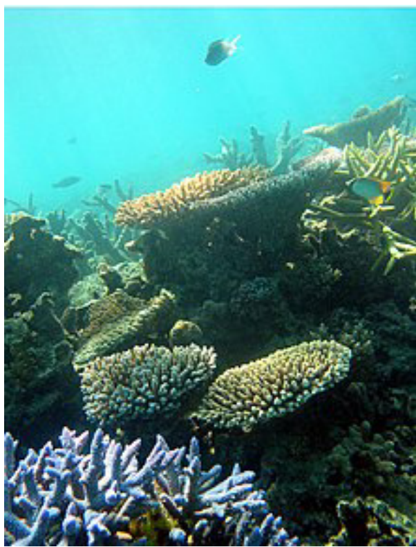
വഴി വൈവിധ്യമാർന്ന സമുദ്രജീവസമ്പത്തിന്റെ തകർച്ചയ്ക്കും വഴിയൊരുക്കുന്നതാണ് പവിഴപ്പുറ്റുകളുടെ നശിക്കുന്നതിനും അതിനുള്ളിലെ പവിഴപ്പുറ്റുകളുടെ നശിക്കുന്നതിനും താല്പര്യമുള്ളതാണ്.

കൊച്ചി: കടലിലെ ഉഷ്ണതരംഗത്തെ തുടർന്ന് ലക്ഷദ്വീപിലെ പവിഴപ്പുറ്റുകൾ വൻതോതിൽ നശിക്കുന്നതായി പഠനം. ദീപ് മേഖലയിലെ പവിഴപ്പുറ്റ് ആവാസ വ്യവസ്ഥയുടെ ഏറ്റവും പഴയ റീജിയണിയിൽ വിയമയമായി കേന്ദ്ര സമുദ്രമത്സ്യ ഗവേഷണ സ്ഥാപനത്തിന്റെ (സി എം എഫ് ആർ ഐ) പഠനത്തിൽ കണ്ടെത്തി.