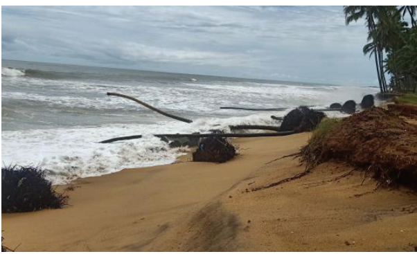
പുവാർ പഞ്ചായത്തിൽ കഴിവുള്ളതായ കടലോര സസ്യമായ കൈകുട്ടിയാണ് ജൈവഭിത്തി നിർമ്മിക്കാനായി തിരഞ്ഞെടുത്തിരിക്കുന്നത്.

കേരള സംസ്ഥാന ജൈവവൈവിധ്യ ബോർഡിന്റെ സഹായത്തോടെ തിരുവനന്തപുരം പുവാർ പഞ്ചായത്തിലെ കടൽത്തീരത്ത് തീരസംരക്ഷണത്തിനായി പതിനാലു സന്ധിയിൽ ജൈവഭിത്തി നിർമ്മിക്കുന്ന പദ്ധതിക്ക് മാർച്ച് എട്ടിന് തുടക്കമാകും.