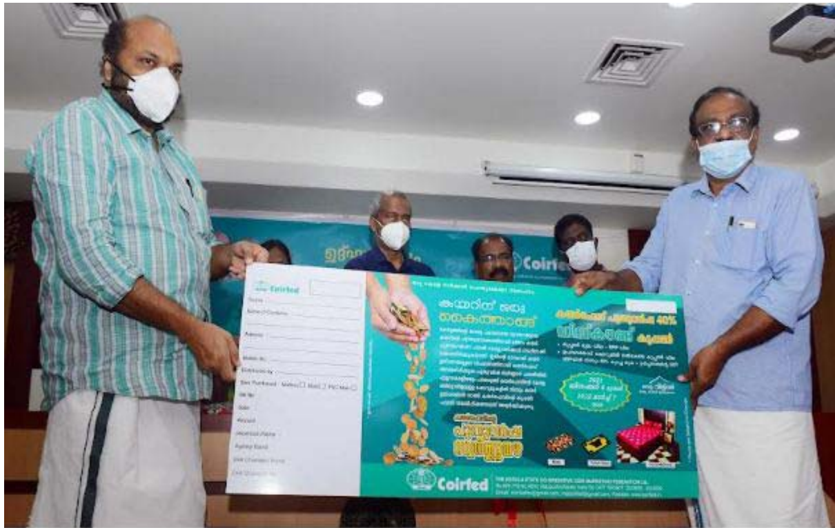
കയർഫെഡിന്റെ പുതുവർഷ സർണ്ണമഴ പദ്ധതിയുടെ ഉദ്ഘാടനം വ്യവസായ മന്ത്രി പി. രാജീവ് നിർവഹിക്കുന്നു